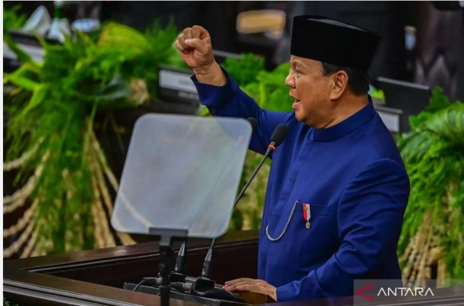
Presiden Prabowo Subianto dalam Pidato Pelantikan, 20 Oktober 2024